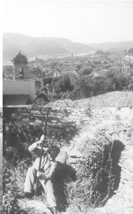
Coups de barre de fer contre une porte en bois.

RICHARD EN SE CACHANT TOMBE DANS UN TROU