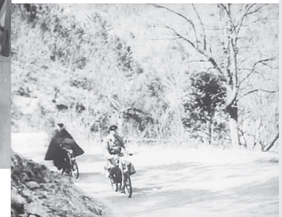
Son de cromorne (mobylette).