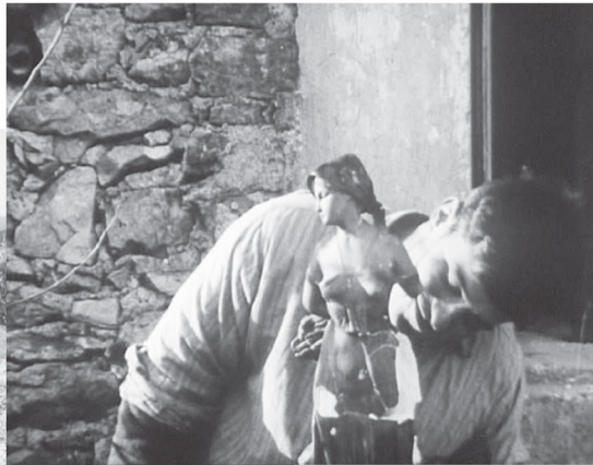
Atmosphère de village à la tombée de la nuit.